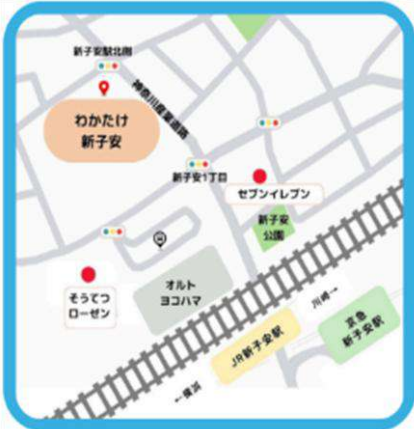
JR京浜東北線 新子安駅から、徒歩約5分 京浜急行 京急新子安駅から、徒歩約5分

社会福祉法人 若竹大寿会 看護小規模多機能型居宅介護 わかたけの家 住所：〒221-0013 横浜市神奈川区新子安1-24-13 2F 開設準備室 電話：045-534-8112 担当 / 田村